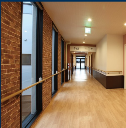
中庭に差す自然光が屋内をやさしく照らします。