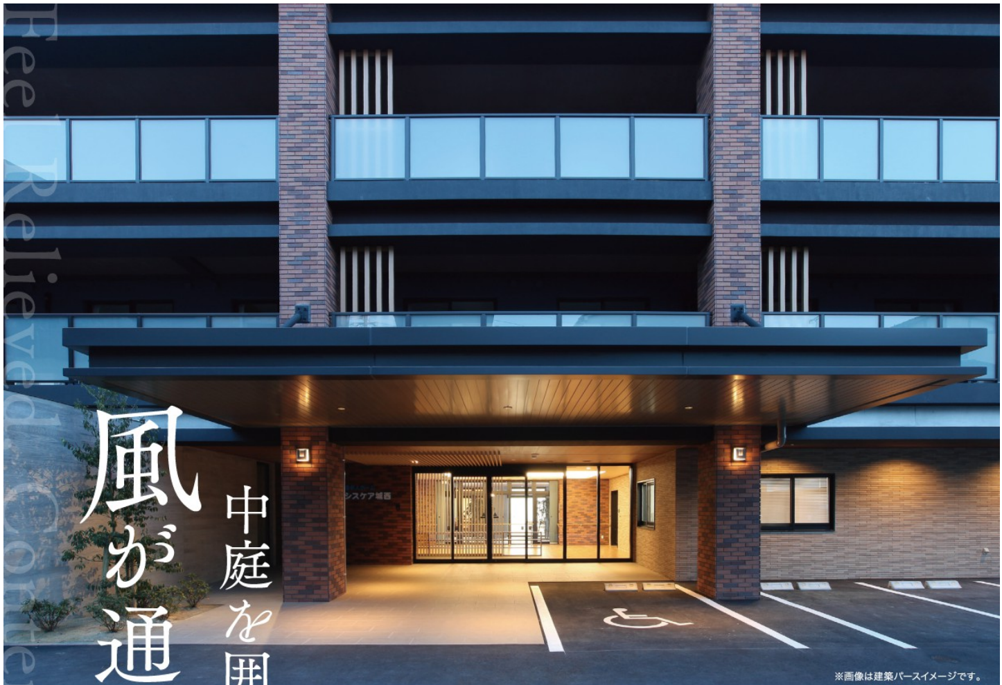
※画像は建築パースイメージです。